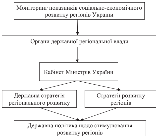
Рис. 2. Реалізація механізму державної політики щодо стимулювання розвитку регіонів в рамках стратегій регіонального розвитку

Загальна схема розробки стратегій регіонального розвитку в рамках реалізації державної політики щодо стимулювання розвитку регіонів передбачає використання результатів моніторингу соціально-економічних показників розвитку території України, а також розробку державної політики щодо стимулювання розвитку регіонів країни (рис. 2).