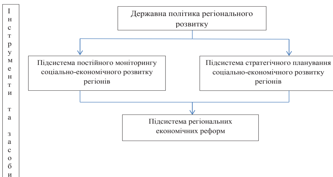
Рис. 1. Підсистема регіональних економічних реформ в системі державної політики регіонального розвитку [8]

Мета статті полягає у обґрунтуванні базових блоків механізму реалізації економічних реформ в країні та її регіонах, а також формуванні ефективних взаємозв'язків між ними.