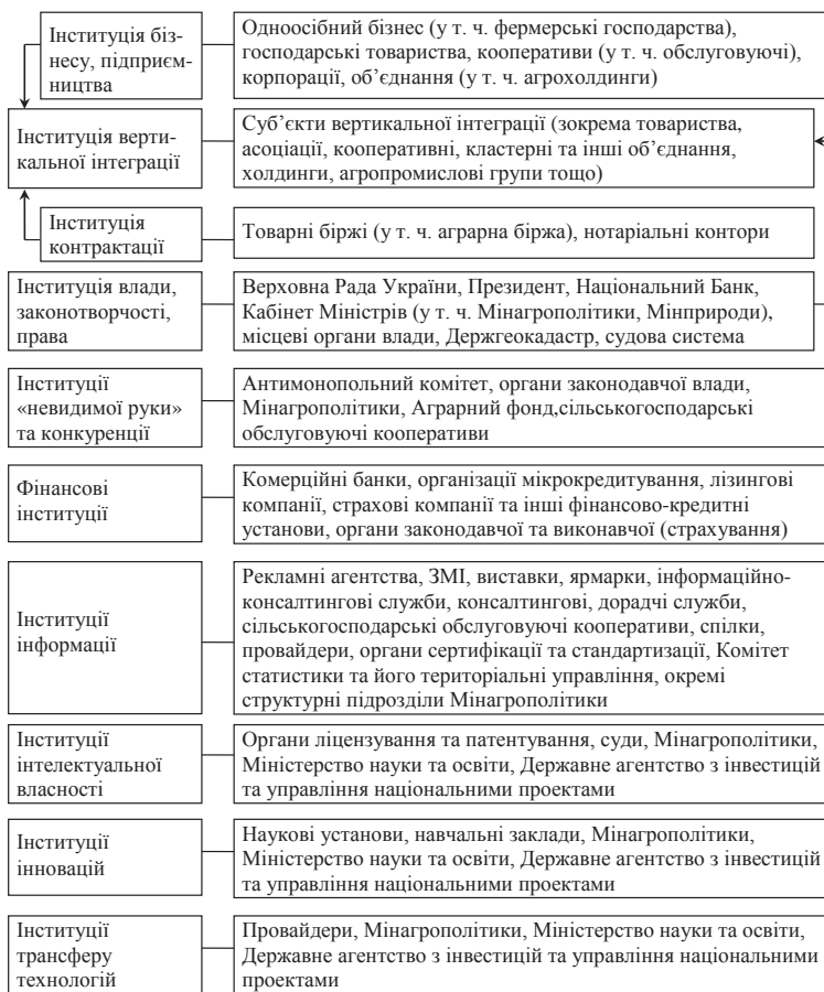
Рис. 2. Базові організації інституційного середовища сільськогосподарського підприємства

Недієвість інституції контрактації ускладнює реалізацію механізмів «невидимої руки» через те, що при здійсненні ринкових операцій умови диктує не ринок, а сторона, яка займає більш вигідні позиції. Особливо це позначається на процесах ціноутворення, коли ціна нав'язується виробникам сільськогосподарської сировини [3, с. 319]. У такій ситуації інституції «невидимої руки» покликані не тільки скоротити невизначеність ринкової кон'юнктури, але й мінімізувати вплив корпоративних структур та об'єднань на кон'юнктуру ринку сільськогосподарської продукції та умови ринкових угод. Скорочення дії невизначеності досягається через укладання контрактів (інституція контрактації за участю згаданих вище організацій), неформальні домовленості (інституція соціального капіталу), дії органів законодавчої (при плануванні державного бюджету щодо держзакупівель) та виконавчої (передусім Мінагрополітики та його структурних підрозділів) влади. Обмеження впливу крупних підприємств здійснюється органами державної влади та через