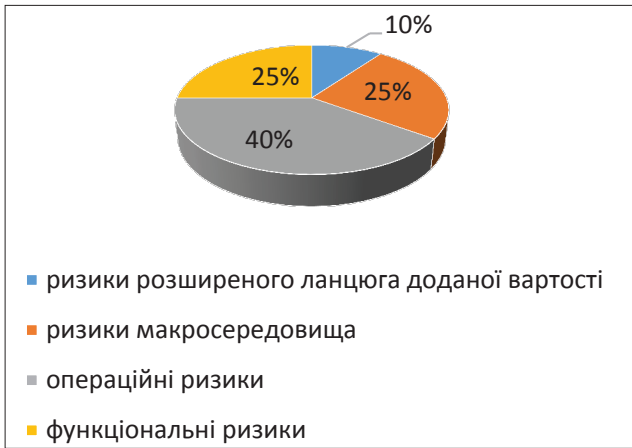
Рис. 2. Структура ризиків, що можуть виникнути на підприємстві торгівлі, %

цію розподілу часу виконання операцій, спираючись на концепцію «точно в строк», яка застосовується для транспортування, але має аналоги для складських систем і виробництва. Перші два показники описуються ймовірнісними характеристиками виконання логістичних операцій в ланцюзі поставок товарів за допомогою комбінацій різних способів їх обчислення відповідно до різних видів відмов.