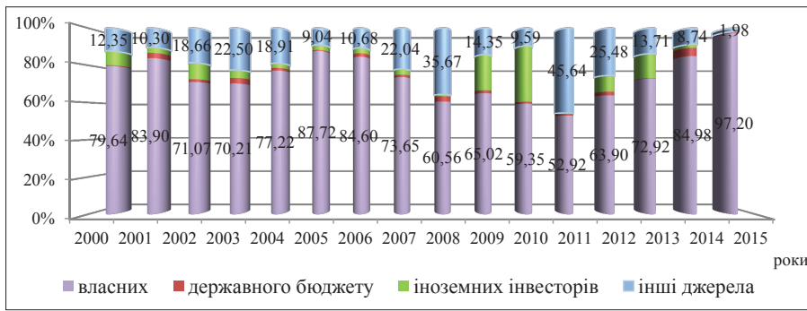
Рис. 1. Показник відносної величини структури джерел фінансування інноваційної діяльності України протягом 2000–2015 рр.